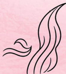
VALOVI KAO S PLAŽE

Otkrij novitete za kosu i pronadi svoj ljetni hair upgrade.